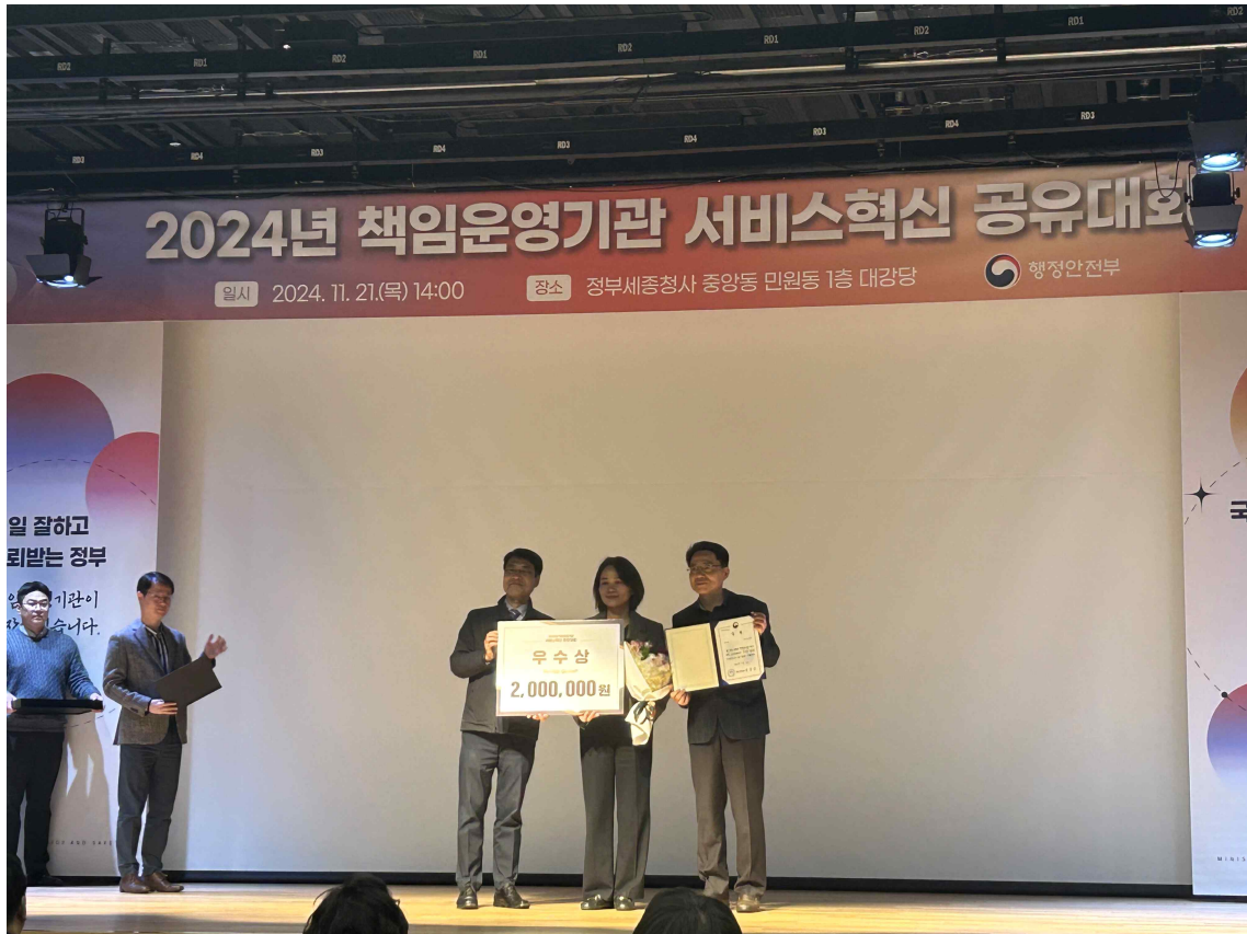
| 수상 사진 |